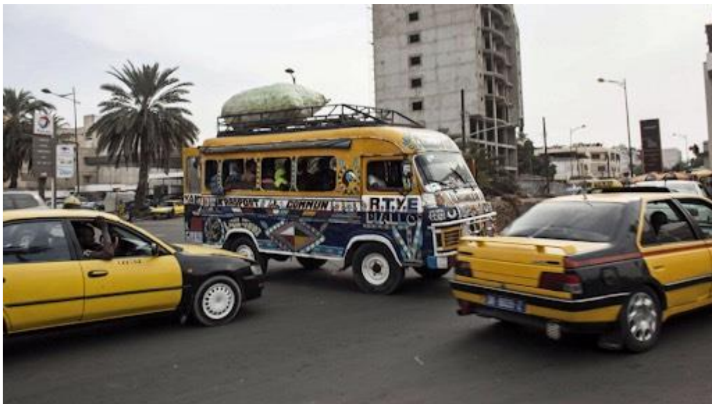
Dakar Senegal.

Ante estas circunstancias y las venideras un cambio de enfoque es inminente, como señala Alain Bourdin, mencionando la muy baja participación de los investigadores. Sin embargo, se puede gestionar la creación de redes de investigación y alentar a los investigadores a opinar activamente sobre los procesos urbanos.